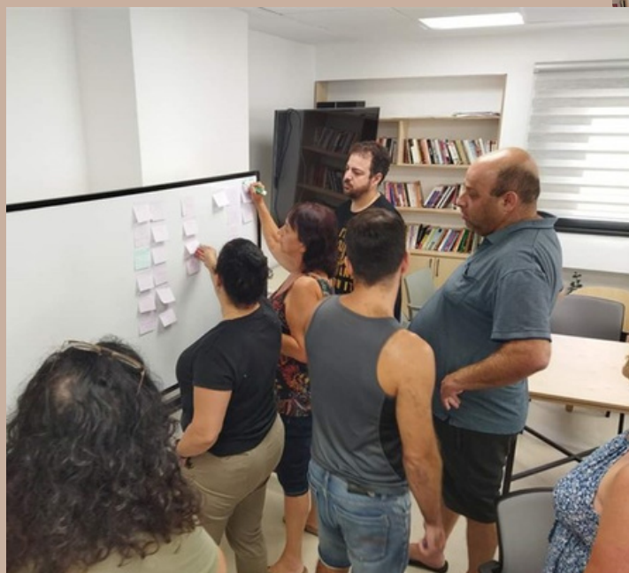
בונים תכנית עבודה משותפת באמצעות מעגל חלימה בועדת תרבות